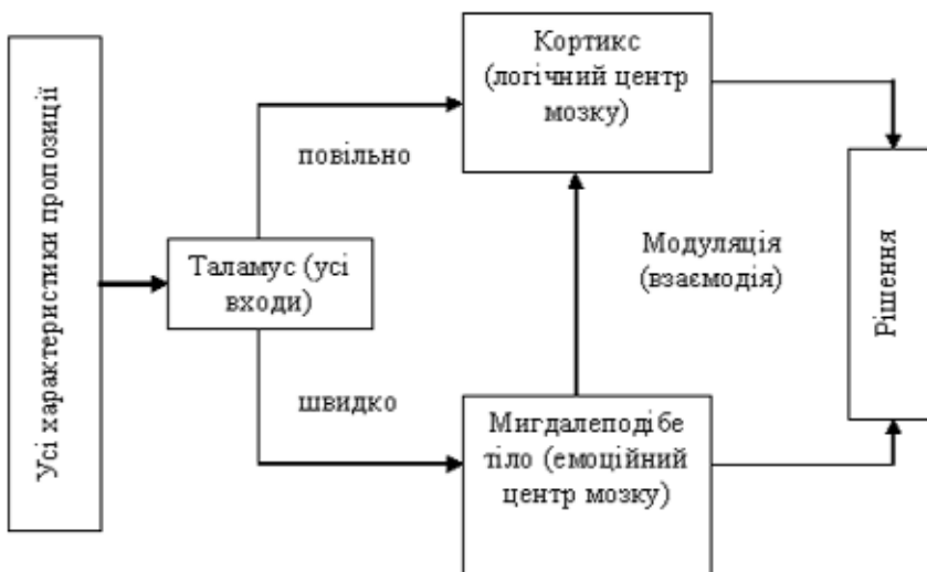
Рис. 1. Асоціативна матриця щодо сприйняття “хороша газета”.

Решта пар слів порівняння була визначена як ті, що перебувають на стику відчуттів, тобто їхні середні числові показники ненабагато відрізнялись у своєму абсолютному виразі.