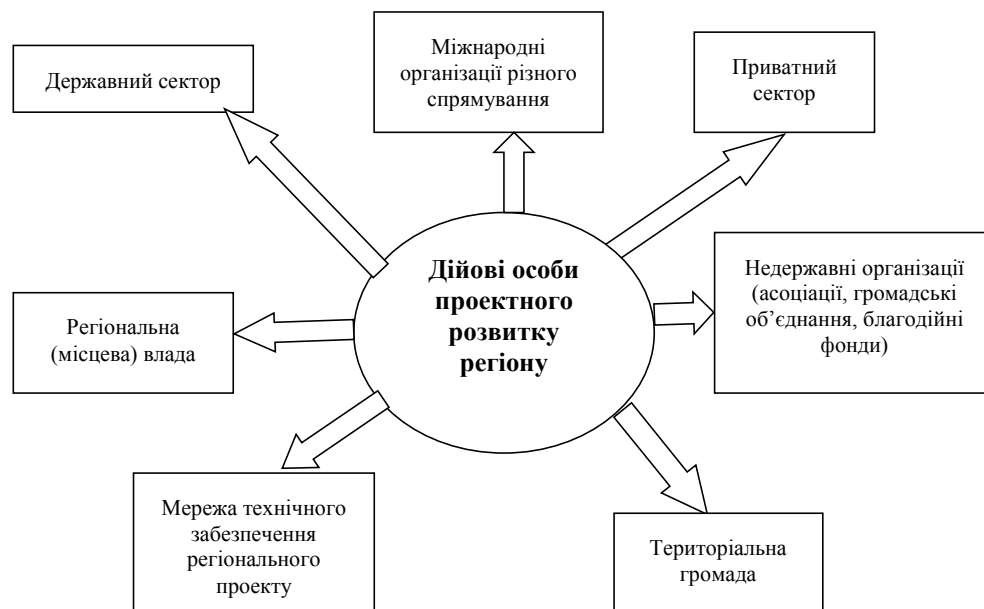
Рис. 2. Дійові особи проектного розвитку регіону

На рис. 2 наведено «дійові особи» проектного розвитку регіону, тобто суб'єкти, які можуть ініціювати, реалізувати або взяти участь у реалізації, фінансувати регіональний проект і користуватись його результатом.