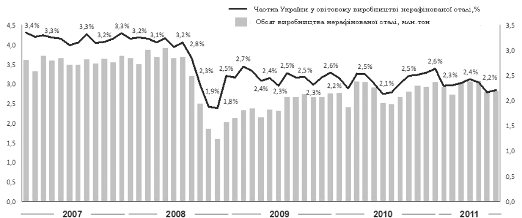
Рис. 2 Обсяги виробництва нерафінованої сталі в світі у динаміці за 2007—2011 рр. (млн т) і частка України у світовому виробництві (%) [3]

В Україні у 2011 р. було вироблено 35,3 млн т нерафінованої сталі, що на 5,7 % більше показника 2010 р. На рис 2. наведено динаміку обсягів виробництва нерафінованої сталі в світі та визначено частку України у світовому виробництві.