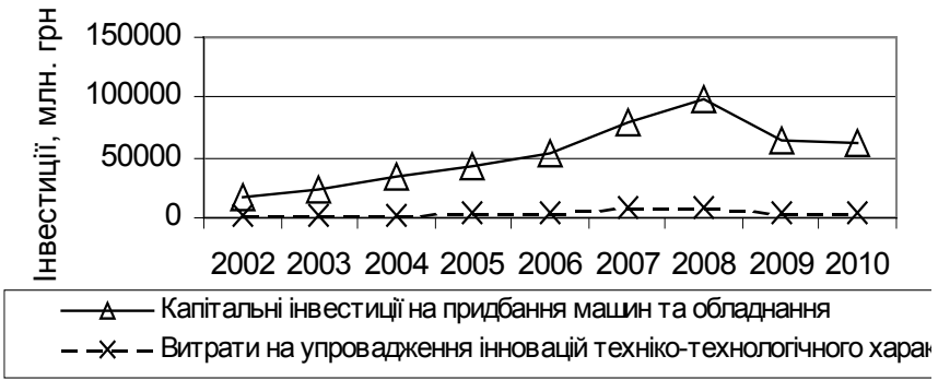
Рис. 1. Співвідношення обсягів витрат на інновації техніко-технологічного характеру і обсягів капітальних інвестицій для придбання машин та обладнання в Україні

придбання нових технологій) із загальним обсягом інвестування цих підприємств у придбання машин та обладнання (серед яких і нові одиниці техніки застарілих конструкцій та принципів дій). Як видно із рис. 1, технологічне оновлення вітчизняних промислових підприємств відбувається в основному на старій технологічній основі. Різниця між вказаними обсягами витрат складає більше десятка разів (зокрема, у 2010 р. це співвідношення складало 1:11,8, у найблагополучнішому з погляду економічної динаміки 2008 році — 1:12,2).