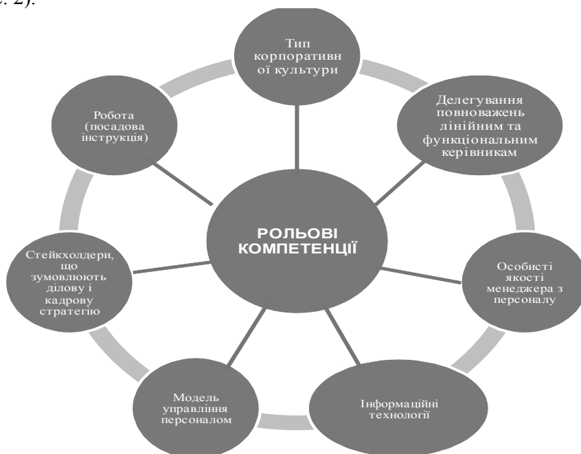
Рис. 2. Діаграма взаємодії факторів формування рольових компетенцій менеджера з персоналу

Графічно формування рольових компетенцій можна зобразити наступним чином (рис. 2).