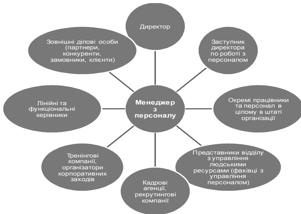
Рис. 1. Рольова постановка менеджера з персоналу

Деякі члени рольової постановки займають такі позиції в посадовій ієрархії, які ставлять їх в ранг осіб, що суттєво впливають на роботу менеджера з персоналу. Інші не мають місця у внутрішній ієрархії, а є зовнішніми учасниками, які також впливають на ефективність діяльності менеджера з персоналу відповідно виконуваної ролі: