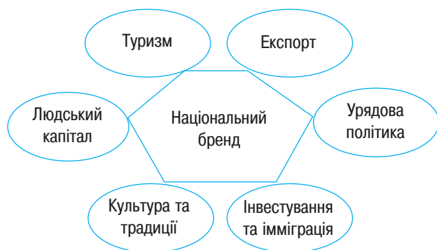
Рис. 1 Шестикутник національного бренду Саймона Анхольта знаходиться в основі вимірювання Anholt-GfK Roper Nation Brands Index (NBI)

Найскладніше при визначенні бренду країни за цією методикою розрізнити дві складові – «інвестування та імміграція» і «людський капітал». Вони є взаємопов'язаними і доповнюють одна одну, їх відмінність полягає у зміщенні наголосу на той чи інший аспект поняття «людські ресурси». Так, визначаючи елемент «людський капітал», у менеджерів середньої та вищої ланки просили розташувати певні країни в порядку надання переваги національності кандидата на посаду. У представників небізнесових структур дізнавались, людину якої національності вони б бажали мати за близького друга. Також респондентів просили назвати одну найяскравішу рису, яка б описувала характер людей з певної країни.