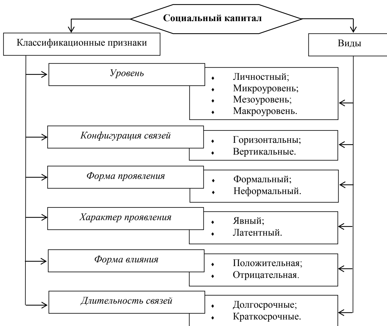
Рис. 2. Классификация понятия социальный капитал