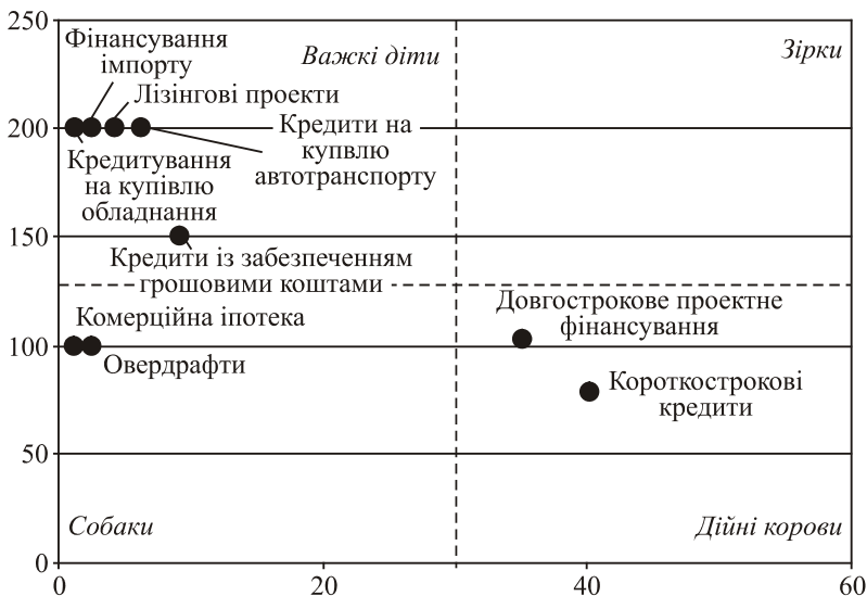
Рис. 3. Портфельний аналіз надання кредитних продуктів банківськими установами

Одним з найперспективніших сегментів банківського кредитування є співпраця з малими суб'єктами господарювання (табл. 4) — за оцінками експертів, цей сегмент кредитного ринку за 1—2 роки може зрости від 5 до 10 разів. Все більше вітчизняних банків намагаються отримати частку ринку цього виду кредитування. Основними конкурентами вітчизняних банків виступають іноземні банки та фонди, зокрема, Європейський банк реконструкції та розвитку, Світовий банк, Німецько-Український Фонд та ін.