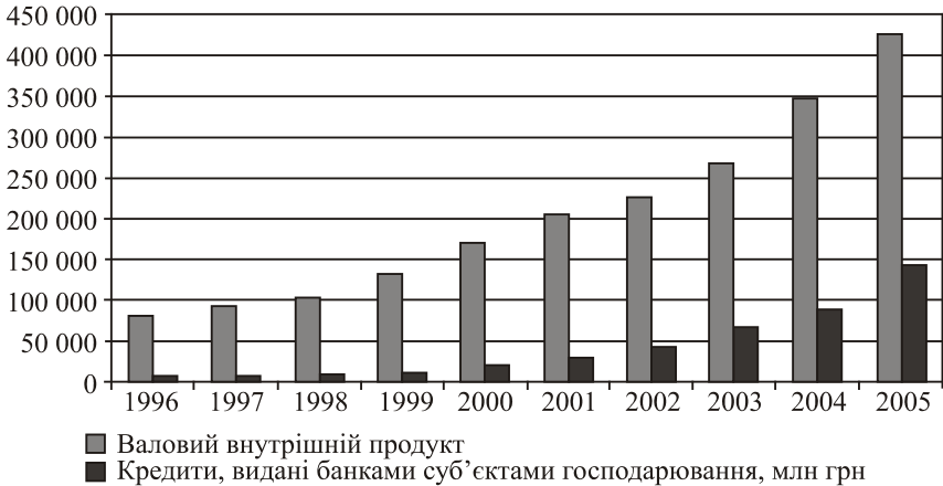
Рис. 1. Динаміка валового внутрішнього продукту і банківських кредитів, наданих суб'єктам господарювання

Ефективність функціонування будь-якого ринку, перш за все, визначається рівнем його конкуренції. З метою оцінки внутрішньогалузевої конкуренції на банківському ринку корпоративного кредитування нами було використано такі показники [6]: