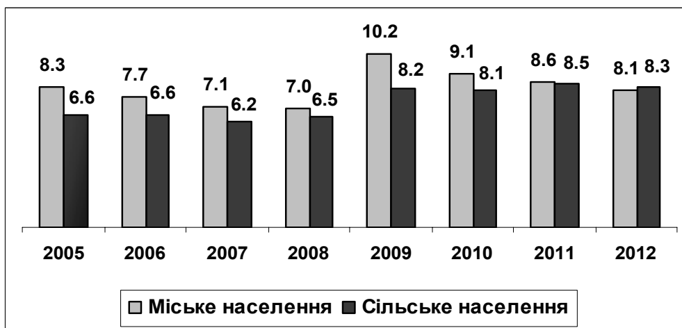
Рис. 3. Рівень безробіття міського та сільського населення України (%) за методологією МОП.