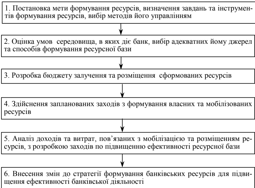
Рис. 2. Схема механізму формування ресурсної бази банку