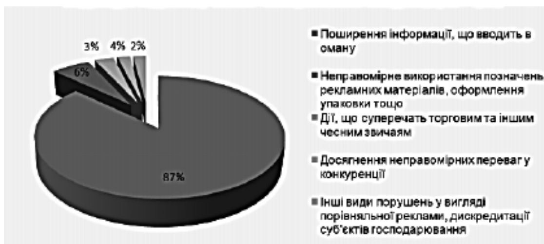
Рис.2 Структура порушень в сфері недобросовісної конкуренції

Збитки, які завдані споживачеві недобросовісною рекламою, підлягають відшкодуванню винною особою у повному обсязі (Закон України «Про захист прав споживачів»).