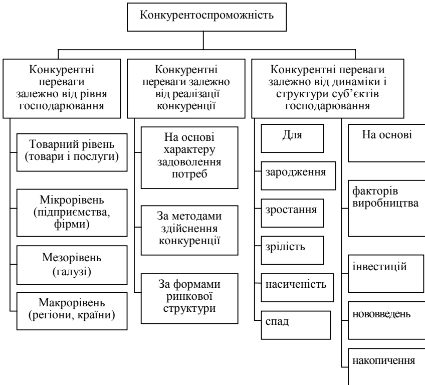
Рис. 2. Класифікаційна структура конкурентоспроможності на основі конкурентних переваг

Конкурентоспроможність виступає визначальним елементом конкуренції і конкурентних відносин з приводу визначення структури забезпечення якнайкращого положення об'єктів і суб'єктів господарювання на ринку. Отже, конкурентоспроможність має різні форми прояву і методи аналізу, які представлено у вигляді класифікаційної структури на рис. 2.