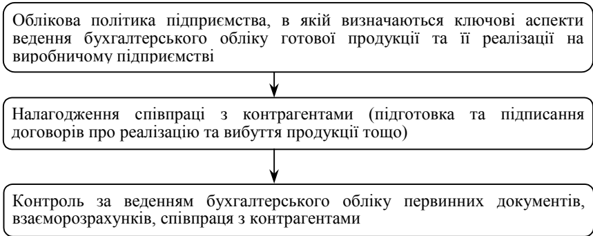
Рис. 1. Етапи організації обліку готової продукції та її реалізації

виготовлена на підприємстві, в установі, призначена для продажу і відповідає технічним і якісним характеристикам, передбаченим договором або іншим нормативно-правовим актам [2]. Для організації процесу реалізації продукції необхідно зрозуміти який життєвий цикл вона проходить, що наведено на рис. 2.