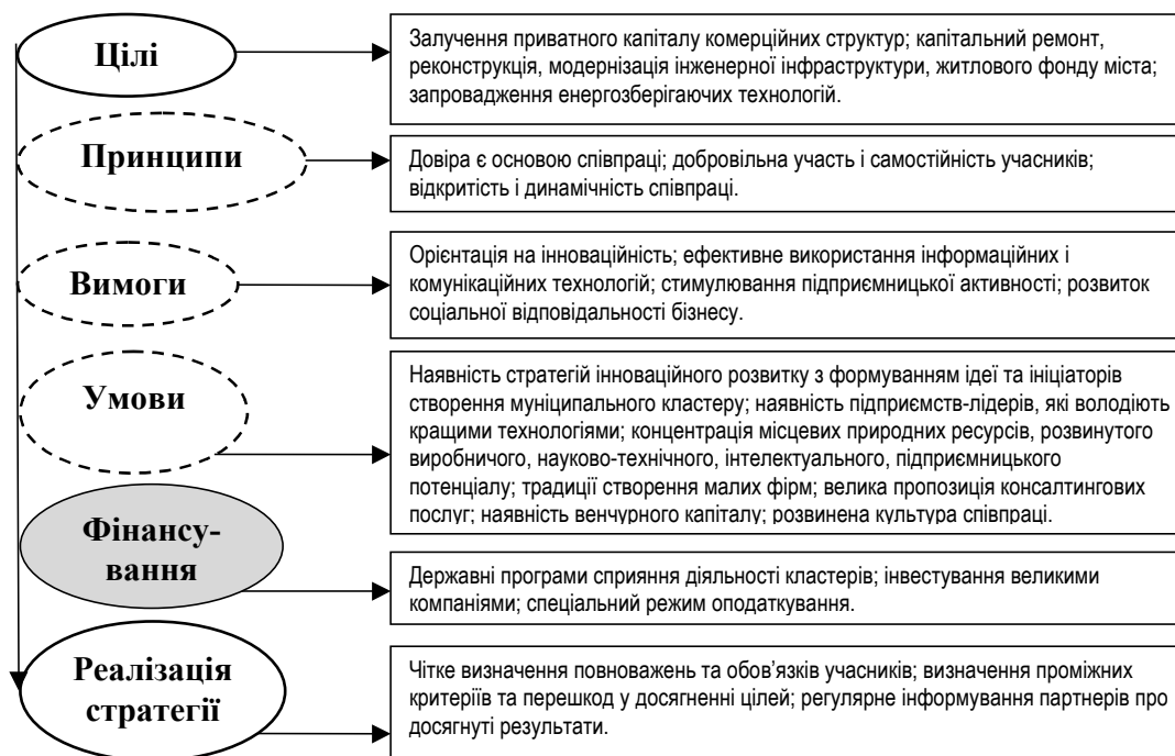
Рис. 1. Засади функціонування муніципального кластеру

суб'єктів та поведінці кластера в цілому. Інструментом ліквідації негативних впливів виступає стратегічне управління, яке виступаючи як багатоплановий процес, допомагає не тільки формулювати та виконувати ефективні стратегії, а й сприяє балансуванню і корегуванню відносин між учасниками кластеру та зовнішнім середовищем для досягнення цілей.