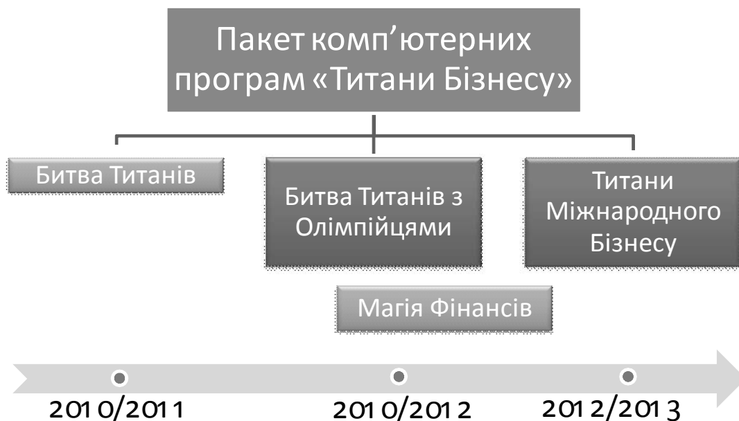
Рис. 3. Генезис комп'ютерних програм із серії «Титани Бізнесу»

Програма «Битва Титанів» реалізована у тренінгу з дисципліни «Планування і контроль на підприємстві», її розширена версія «Битва Титанів з Олімпійцями» та індивідуальна версія «Магія Фінансів» у тренінгу з дисципліни «Економічну управління підприємством». У 2013 році комп'ютерна ділова гра «Титани міжнародного бізнесу» вперше апробована на факультеті міжнародної економіки під час організації виробничої практики [7].