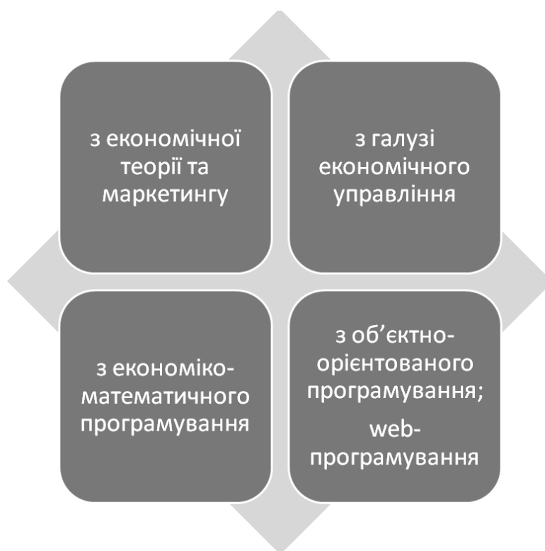
Рис. 2. Комплекс знань, навичок і вмінь для створення комп'ютерних ділових ігор

підставі науково-обґрунтованих і передбачає володіння знаннями, навичками і вміннями з різноманітних галузей знань. Загальне уявлення про комплекс знань, навичок і вмінь, необхідних для створення комп'ютерних ігор подано на рис. 2.