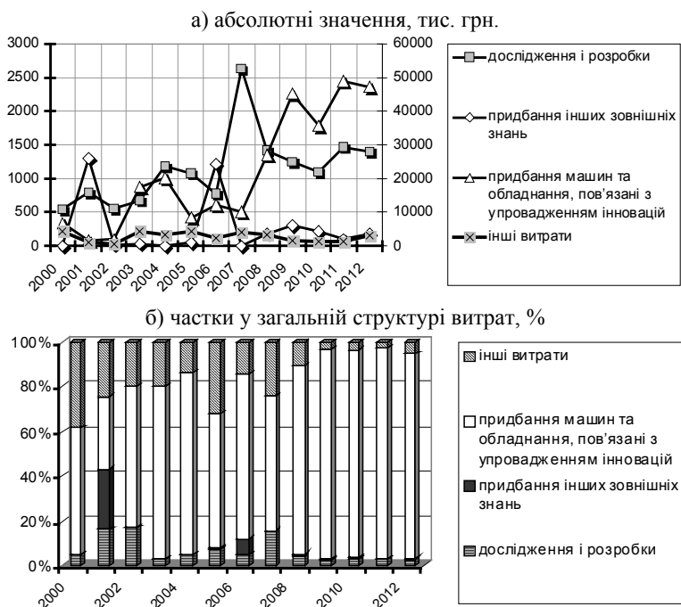
Рис. 1. Обсяг і структура витрат промислових підприємств Чернівецької області на інноваційні цілі, 2000—2012 рр.*

* Складено автором на основі джерела: [3]