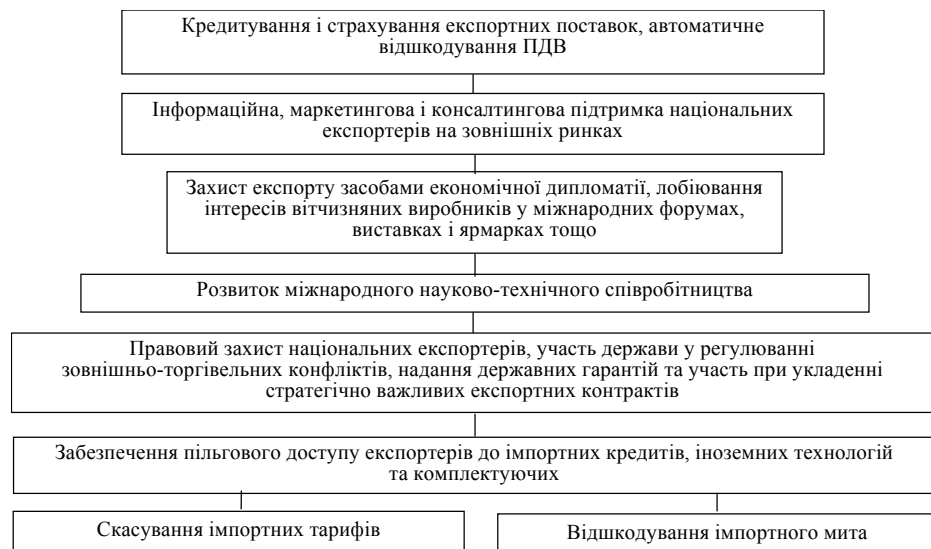
Рис. 4. Механізми державного захисту національних експортерів

Недоліком є те, що інші країни прагнуть накладати протекціоністські перепони на вітчизняну промисловий експорт. Якщо раніше зазвичай практикувалось накладання високих тарифних ставок на імпорт, то сьогодні, в умовах членства в СОТ, широко застосовуються технічні бар'єри (фітосанітарні та екологічні вимоги, антидемпінгові розслідування, вимоги до пакування та маркування тощо), не виключені також і прямі заборони.