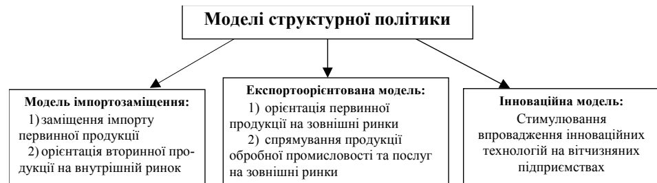
Рис. 3. Моделі структурної політики

1. Модель імпортозаміщення базується на стимулюванні внутрішнього виробництва та послабленні зовнішнього конкурентного тиску шляхом протекціоністських заходів. Першими, хто визнавав доцільність протекціонізму як дієвого методу для забезпечення економічного розвитку країни, були меркантилісти: Т. Мен («Багатство Англії у зовнішній торгівлі») і Ф. Ліст («Національна система політичної економії»). Різновидами моделі є: політика орієнтації первинної або вторинної продукції на внутрішній ринок. На практиці ця модель реалізується шляхом створення спільних підприємств із іноземними компаніями, яких приваблює виробництво під захистом митних і податкових пільг.