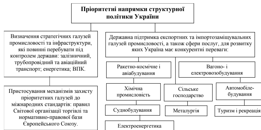
Рис. 5. Пріоритетні напрямки структурної політики України

Інноваційна модель містить позитивні риси попередніх двох моделей, проте позбавлена їх недоліків. Сутністю парадигми інноваційного розвитку є досягнення економічного розвитку шляхом широкомасштабного введення у господарський обіг продуктів інтелектуальної праці як знань, технологій, науково-технічних розробок тощо для їх комерціалізації та досягнення соціально-економічного ефекту 23 . Вона полягає у стимулюванні державою впровадження інноваційних технологій на вітчизняних підприємствах. Оскільки, розробка і впровадження інновацій є довготривалим процесом, а компанії прагнуть отримувати швидкі прибутки, то завданням держави повинно стати створення таких умов, які б дозволяли підтримувати інноваційний процес до стадії проектною готовності нового продукту, коли він малопривабливий для компаній з точки здійснення витрат на нього, а також створення стимулів останнім для впровадження готового інноваційного продукту чи технології».