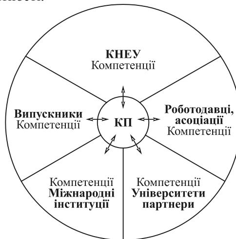
Рис. 4. Формування комунікативного поля (КП)

Д. Белл, досліджуючи постіндустріальне суспільство, вказує на перехід економіки від переважно виробництва товарів до виробництва послуг, проведення досліджень, організації систем освіти і підвищення якості життя. Постіндустріальне суспільство передбачає виникнення цілого «класу» — консультантів, експертів, технократів, тобто людей, які характеризуються високою цілісністю життєвої компетентності.