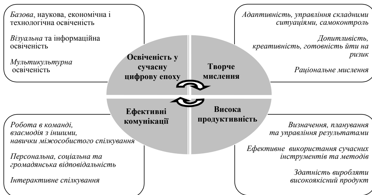
Рис. 3. Уміння і навички XXI століття

Наведена класифікація вмінь і навичок характеризується відносною універсальністю, оскільки відображає глобально значущі на сьогодні компетенції, яких повинен набувати кожен студент у ході навчання в будь-якому університетському закладі.