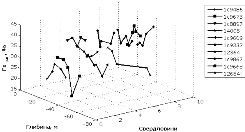
Рис. 3. Мінливість вмісту заліза загального ( Fe_{\text{заг}} ) у вихідній руді на Інгулецькому родовищі (м. Кривий Ріг)

Імовірна природа геологічних показників щодо кількості, якості та просторового розвитку корисної копалини в надрах, а також невизначеність у прогнозі економіки освоєння родовищ ускладнює задачу економічного оцінювання запасів мінеральної сировини та прийняття раціональних рішень щодо їх видобутку та переробки. У цьому зв'язку на рис. 3 показано мінливість вмісту заліза загального ( Fe_{\text{заг}} ) у вихідній руді, отриману на підставі геологорозвідувальних даних ВАТ «Інгулецький ГЗК» у блоці, що готується до розробки корисної копалини.