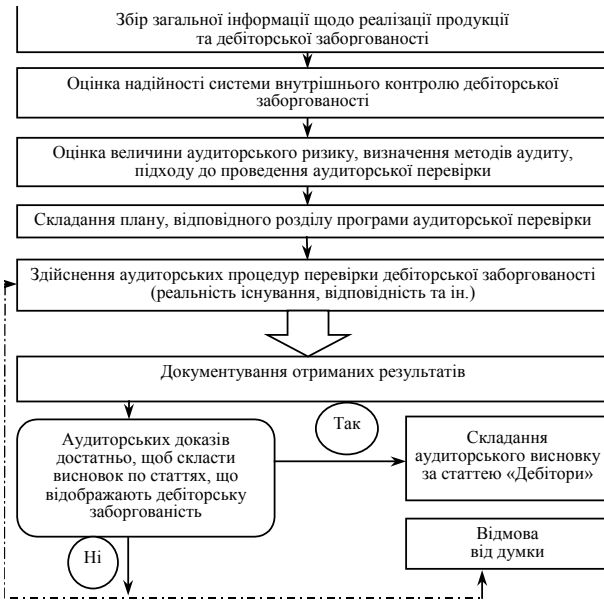
Рис. 1. Послідовність проведення аудиторської перевірки дебіторської заборгованості

зіставної інформації за попередні звітні періоди; арифметичними неточностями; не взяттям до уваги вхідного сальдо по рахунку «Резерв сумнівних боргів»; шахрайством із сумами дебіторської заборгованості підзвітних осіб; відображена дебіторська заборгованість не належить підприємству [2].