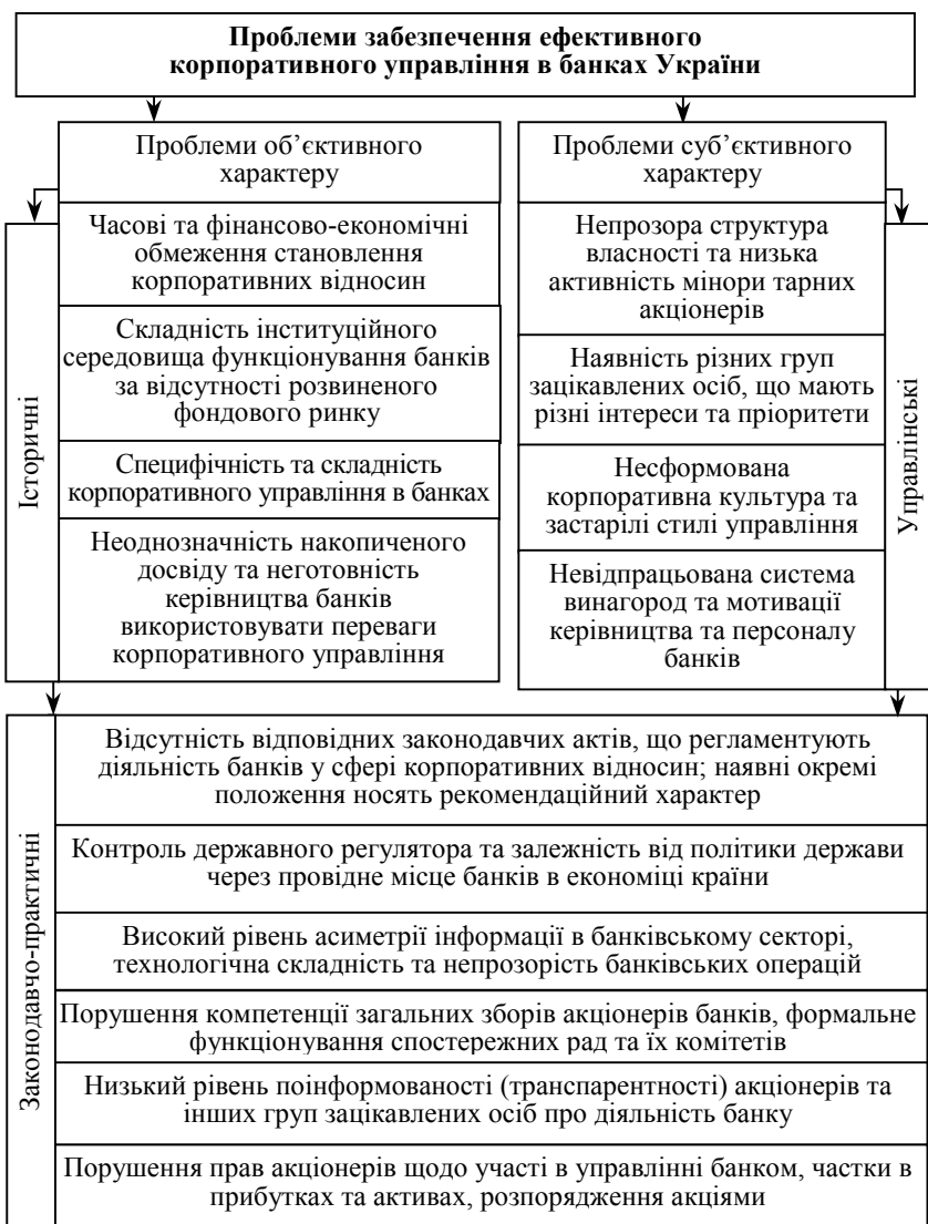
Рис. 2. Проблеми забезпечення ефективного корпоративного управління

Якість управління в кредитній організації зовсім не є лише внутрішньою справою самих професійних банкірів. Виконуючи ряд публічних функцій в економіці, банки діють на перетині ін-