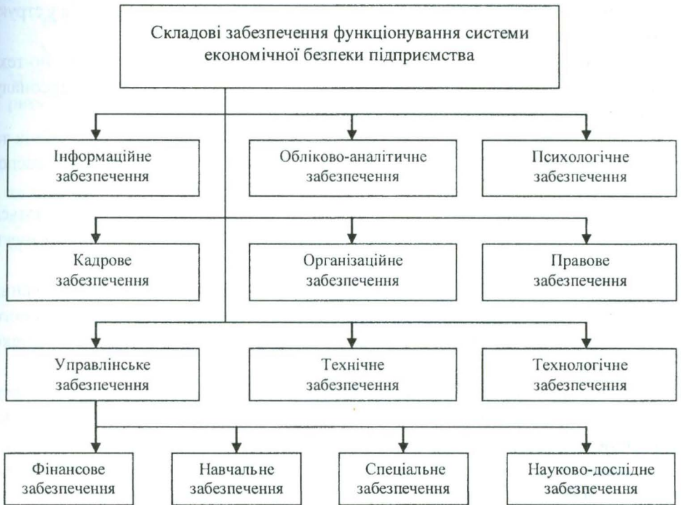
Рис. 1. Основні складові забезпечення функціонування системи економічної безпеки суб'єктів господарювання

Традиційно система забезпечення економічної безпеки включає інформаційне, правове, технологічне, технічне, кадрове забезпечення, що дає можливість всебічно управляти цією системою (рис. 1).