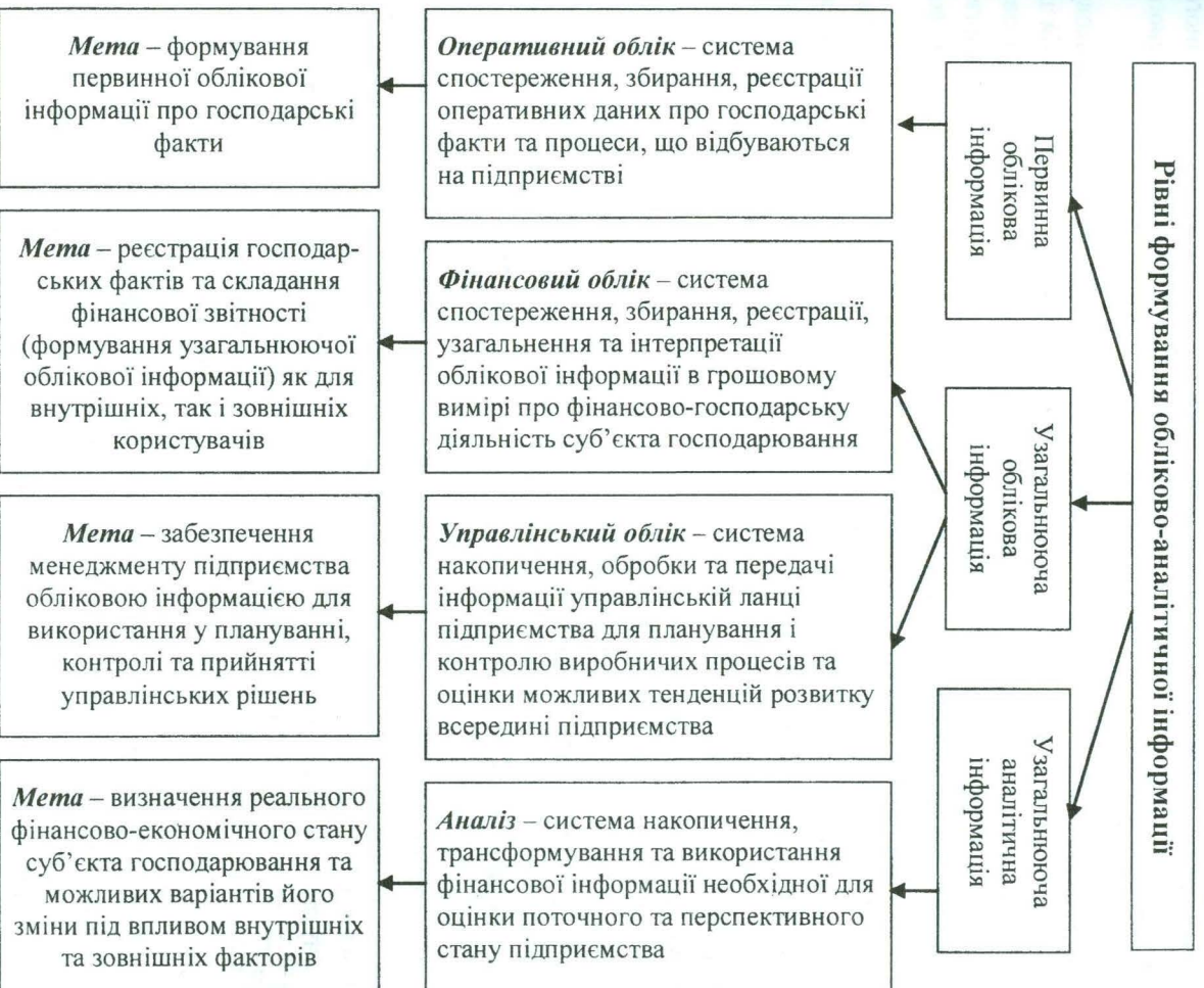
Рис. 3. Рівні формування обліково-аналітичної інформації

Розкриємо економічний зміст зазначених категорій та їх призначення в процесі підготовки обліково-аналітичної інформації у вигляді структурно-логічної схеми, наведеної на рис. 3.