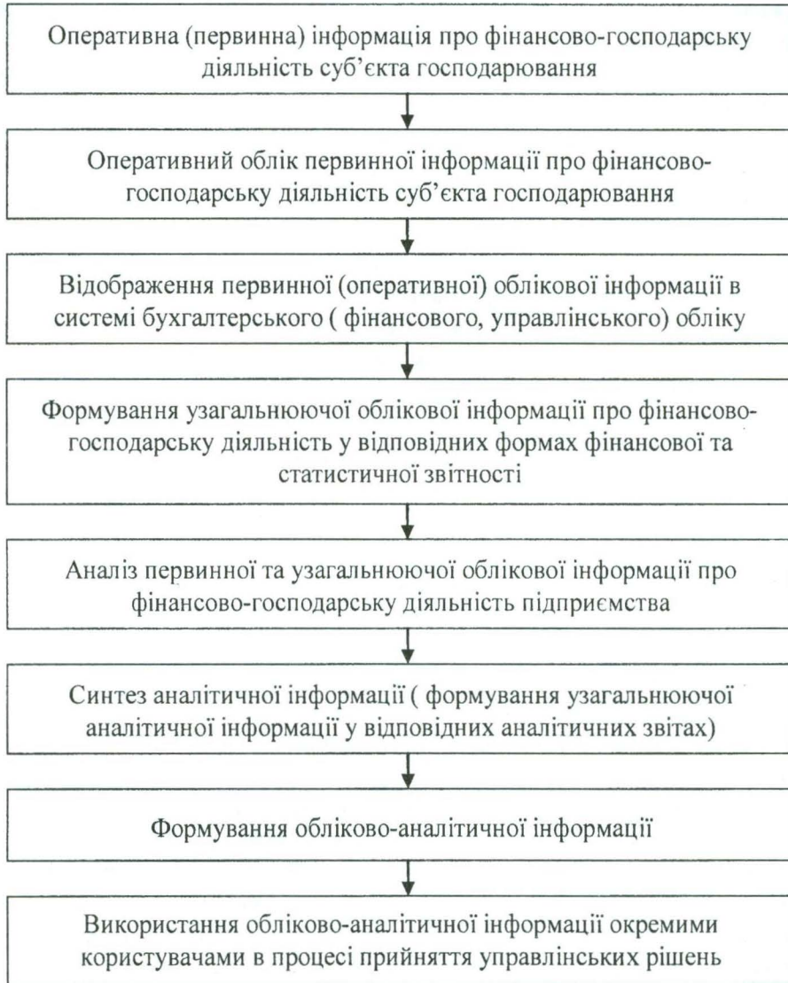
Рис. 4. Процес формування обліково-аналітичної інформації в системі інформаційного забезпечення економічної безпеки підприємства

ського обліку перетворюється на узагальнюючу облікову інформацію, що міститься у фінансових та статистичних звітах. Узагальнююча облікова інформація є базою для її аналізу та синтезу. Узагальнююча облікова та аналітична інформація в сукупності (при об'єднанні) утворюють обліково-аналітичну інформацію, призначену для користувача, що приймає управлінські рішення.