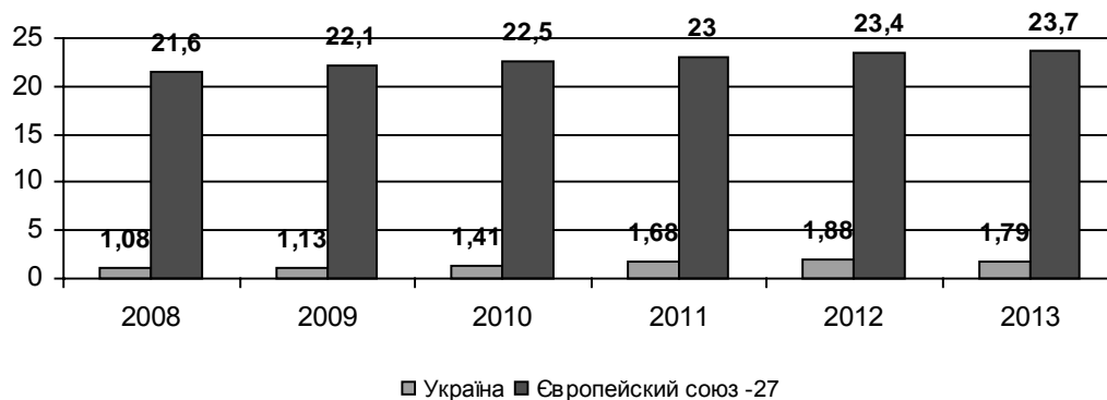
Рис. 2. Середня заробітна плата країн Євросоюзу та України за годину, євро 1

З рисунку видно, що привабливість країн Євросоюзу для українців є досить високою, адже вартість години роботи найманого працівника коливається в межах 1:20 у 2008 році й 1:13,2 у 2013 році. Разом з тим, даний індикатор некоректно описує ризики міграції. На думку автора, необхідно враховувати імовірність працевлаштування закордоном (лише у випадку, коли гарантії працевлаштування для громадян України є високими, ризик втрати робочої сили через міграційні процеси стає реальним). Тому пропонуємо обчислювати значення маркера «міграційного демотиватора» заробітної плати. Його краще розраховувати для регіонів. Зважаючи на зміст індикатору, для нашого прикладу, обчислюватимемо «демотиватор» за даними Євросоюзу.