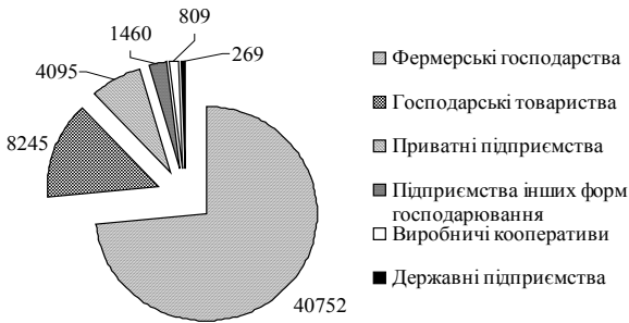
Рис. 3. Кількість діючих в Україні аграрних формувань у 2013 р.

Сімейні фермерські господарства (в Україні — 40752) змушені конкурувати з корпоративними формами господарств у продовольчому виробничо-збутовому ланцюзі. Іноді дрібні сімейні фермерські господарства виключаються зі стандартного процесу розміщення замовлень і продовольчого виробничо-збутового ланцюга навіть із-за необхідності укладання значної кількості контрактів (рис. 3) [3]. Пошук балансу інтересів слід здійснювати не у знищенні або дискримінації одного типу господарств на користь другого типу, а у максимальному використанні і підсиленні тих переваг, що мають агроформування обох типів.