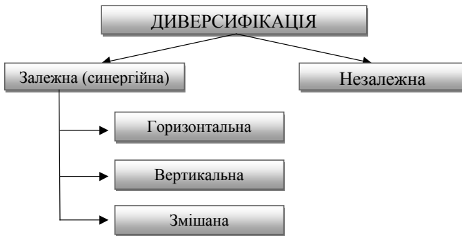
Рис. 1. Блок-схема видів диверсифікації

вого продукту, за умови, що жодна з ланок нової виробничої та невиробничої системи ніяким чином не пов'язана з стандартним виробництвом. Виходячи з цього, ми не спостерігаємо антисипатії інвестиційних портфельних ризиків, за винятком тих ризиків, що пов'язані з реєстрацією, початком операційної діяльності та фінансовим навантаженням на оплату праці адміністративному комплексу, також не спостерігається компліментування виробничих активів. Основна і головна перевага, що міститься в інвестуванні у не кореляційну диверсифікацію є згладжування циклічності виробництва, будь то сезонність чи інші особливі риси виробництва, що дозволяє підприємству отримати більшу фінансову стійкість, провадити якісніше бюджетування операційної діяльності.