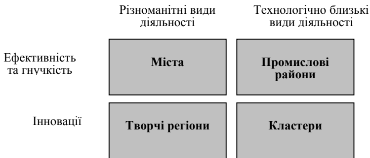
Рис. 1. Чотири види об'єднань

Для того, щоб відокремити різні види економічних об'єднань, можна зробити класифікаційну схему (рис. 1). Дана схема відображає ефективні переваги (в основному завдяки ефекту масштабу), що мають кластери та об'єднання технологічно пов'язаних учасників [2, с. 14].