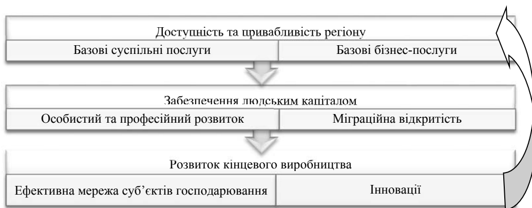
Рис. 1. Цикл створення доданої вартості регіонального розвитку

Результати. Для формування підходу у тлумаченні поняття конкурентоспроможності територіальних громад з прикладної точки зору проведемо аналогію з поняттям конкуренції у бізнесі. Основою для конкурентоспроможності підприємств є збільшення комплексних показників ефективності та показників додаткової вартості виробленої та реалізованої продукції [6]. Розвиток продуктивних секторів регіональних економік та підвищення їх конкурентоспроможності, що ґрунтується на функціонуванні замкненого циклу створення доданої вартості (рис. 1).