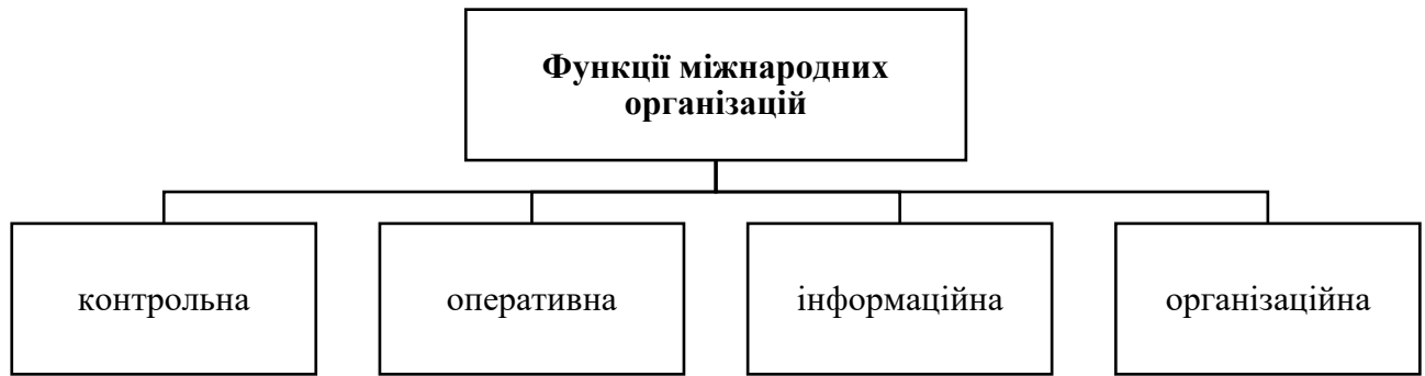
Рисунок 2.2 – Основні функції міжнародних організацій

Основні функції міжнародних організацій наведені на рис. 2.2.