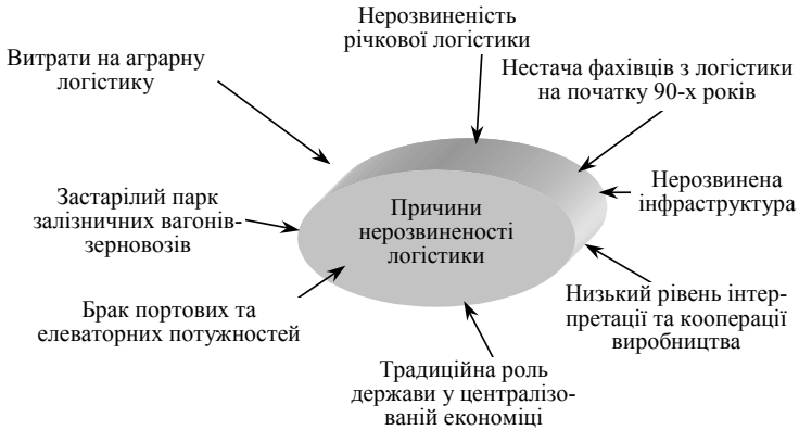
Рис. 1. Причини нерозвиненості логістики в АПК України

Витрати на логістику українських компаній значно більші за витрати аналогічних європейських чи американських компаній. За підрахунками компанії Noble Resources Ukraine, вартість витрат на транспортування і сертифікування до порту, а також вартість перевалки на FOB становить для України 50 дол./т, тоді як для США та країн ЄС 29 і 24,2 дол./т відповідно [2].