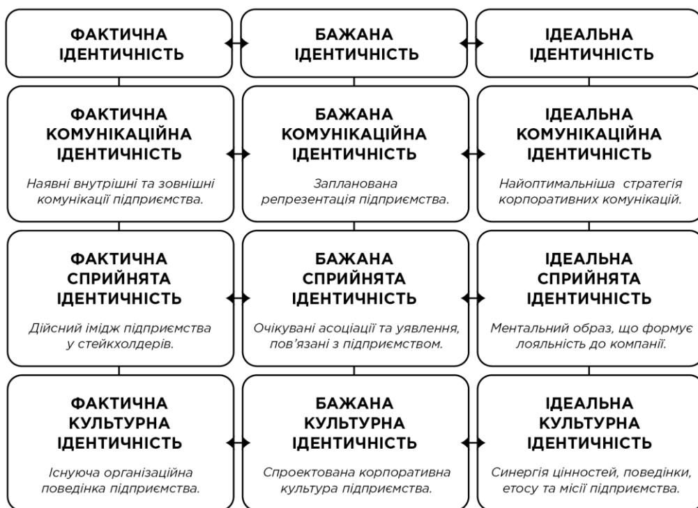
Рис. 2. Структурна класифікація видів корпоративної ідентичності

Варто зазначити, що представлене визначення зв'язків між фактичною, бажаною та ідеальною ідентичностями не протилежить позиції автора методу AC4ID, у визначенні чотирьох інших видів пропонуються значні зміни у визначенні. Комунікаційна, сприйнята та культурна ідентичності мають троїстий характер, оскільки при їх аналізі виявляється одночасно їх фактична, бажана і ідеальна складова ідентичності. Згідно до цього, авторами створено модель структурної класифікації видів корпоративної ідентичності (рис. 2).