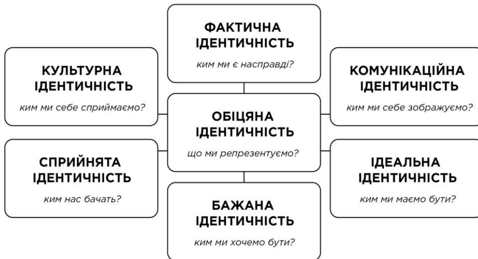
Рис. 1. Класифікація корпоративної ідентичності за методом AC4ID

Метод аналізу AC4ID було створено головою Міжнародної групи з корпоративної ідентичності (ICIG) Дж. Балмером і Г. Суненом для визначення стратегії та методів управління ідентичністю підприємств. Тест розроблений для науковців, менеджерів і консультантів з корпоративної ідентичності та спрямований на аналіз взаємозв'язків між її видами, що також відображено у назві тесту [17]. Згідно до методу, класифікують такі сім видів корпоративної ідентичності (рис. 1).