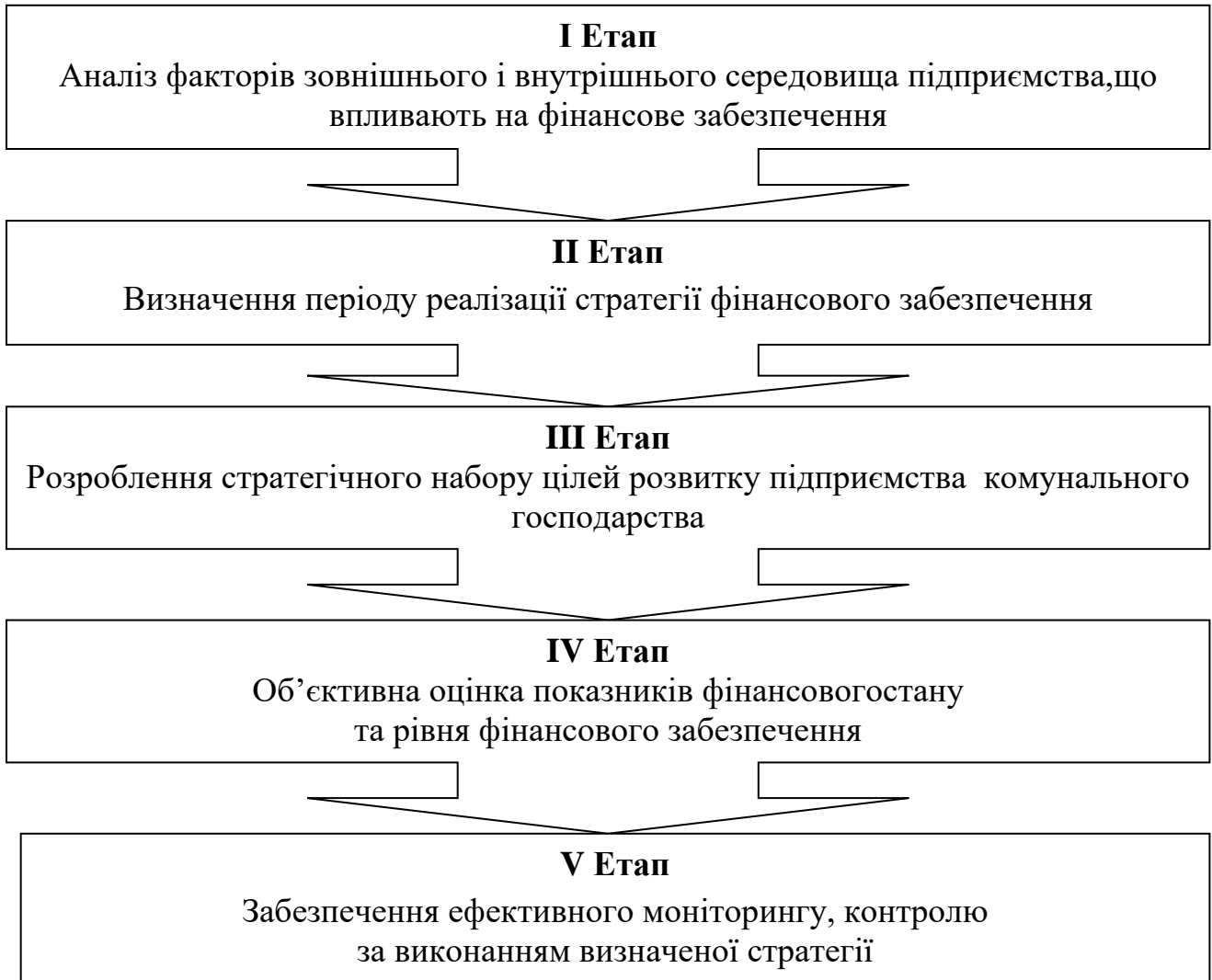
Рис. 3. Етапи процесу формування та реалізації стратегії фінансового забезпечення підприємств комунального господарства*

У роботі обґрунтовано, що стратегія фінансового забезпечення підприємств комунального господарства повинна здійснюватись у кілька етапів (рис. 3).