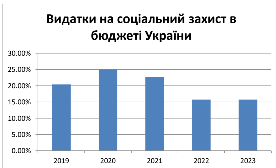
Рис. 2.2 – Частка видатків на соціальних захист в бюджеті України

Однак, важливо зазначити, що система соціального захисту може бути дуже дорогою для держави. Наприклад, дослідження показують, що витрати на соціальний захист в країнах Європейського Союзу становлять понад 40% від загального бюджету [45]. Тому, для досягнення економічної стійкості та розвитку, необхідно забезпечувати ефективне використання коштів та оптимізувати систему соціального захисту.