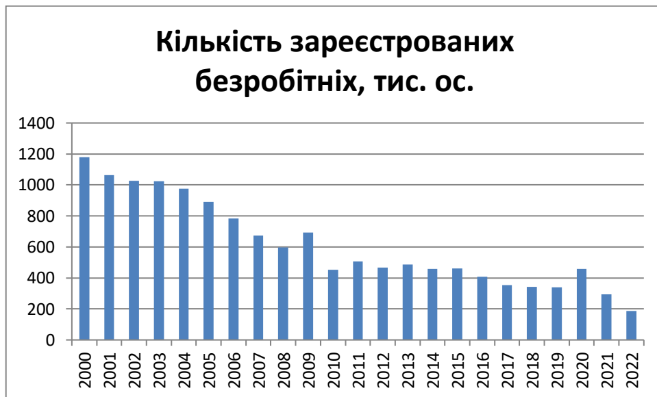
Рис. 2.1 - Кількість зареєстрованих безробітних в Україні з 2000 по 2023 рр. (кільк. населення в тис.), з 2014 р. – без урахування окупованих територій (Криму, Севастополя, частини Донбасу)

через створення нових робочих місць, сприяння переходу на повну зайнятість, забезпечення прав працівників та соціального захисту для них, а також зменшення рівня дискримінації на ринку праці. Один з ефективних інструментів для досягнення цих цілей - це активна соціальна політика, яка може включати в себе різноманітні заходи, такі як розвиток професійної освіти та підвищення кваліфікації, забезпечення доступу до якісної медичної допомоги та житла, а також допомогу у забезпеченні доступної та якісної освіти для дітей.