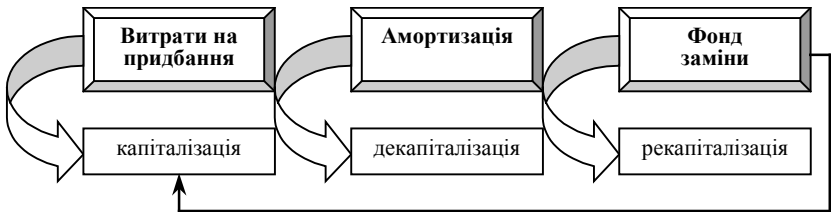
Рис. 2. Взаємозв'язок капіталізації, декапіталізації та рекапіталізації витрат на придбання засобів праці

Сучасна методика бухгалтерського обліку основних засобів відображує лише декапіталізацію витрат, але не фіксує процес рекапіталізації. Накопичені за кредитом рахунку 13 «Знос (амортизація) необоротних активів» амортизаційні відрахування виступають в якості регулятиву при визначенні балансової вартості основних засобів, що знаходяться в експлуатації, і не пов'язані з формуванням і використанням амортизаційного фонду.