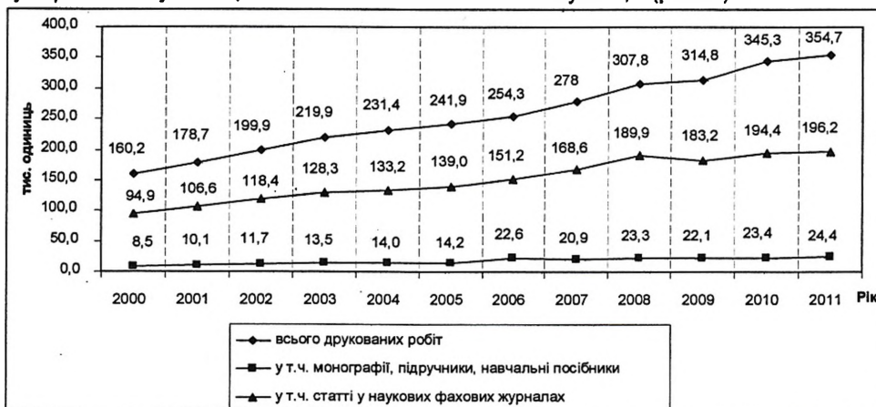
Рис. 2. Публікаційна активність науковців в Україні у 2000-2011 рр. Джерело: [2, С. 124; 3, С. 167; 4, С. 176; 5, С. 162; 6, С. 139; 7, С.142].

Продовжує зростати публікаційна активність вітчизняних науковців (рис. 2).