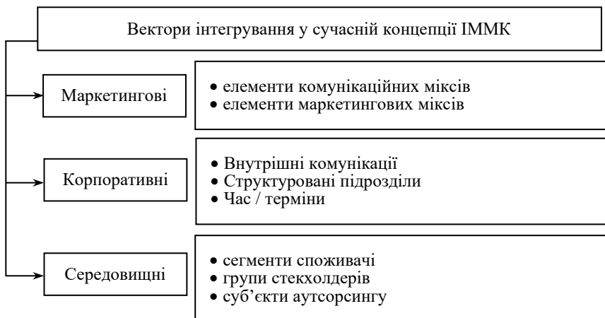
Рис. 1. Вектори інтегрування у сучасній концепції інтегрованих міжнародних маркетингових комунікацій