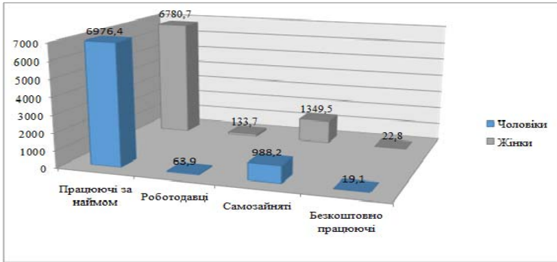
Рис. 3. Динаміка зайнятості чоловіків і жінок*