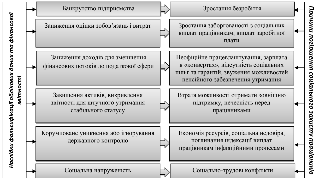
Рис. 1.5. Причинно-наслідковий зв'язок між обліковими фальсифікаціями та погіршенням соціального захисту працівників [10, с. 8]