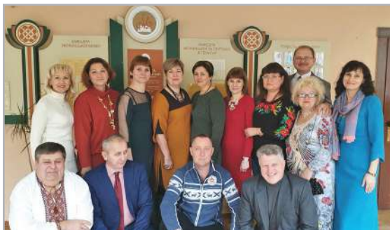
Зустріч колег-одногрупників, 2019

Але думаю, що мені-таки вдалося розшифрувати цю частину коду. Жінок підкорює харизма. А це означає, що можна навчитись правилам етикету, але з харизмою треба народитись. І слід віддати належне силі волі Юрія Миколайовича.