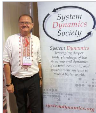
Конференція із системної динаміки, м. Альбукерке, США, 2019

– Я виконував свою роботу, – відповів мудрець, – спочатку я пробудив у вас спрагу, яка змусила вас зайнятися пошука-