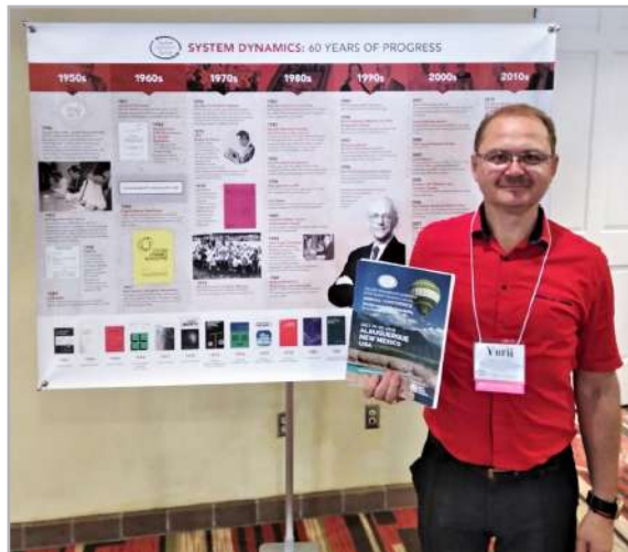
Наукова конференція із системної динаміки, м. Альбукерке, США, 2019