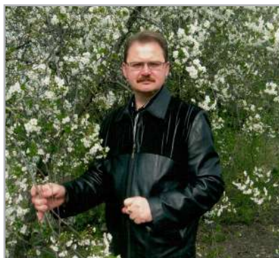
Біля рідної домівки, Дніпропетровщина, 2004

колючками 8–10 сантиметрів. А на трюмо у прихожій, стояли у здоровенних вазонах «щучі хвости» – так ми називали сансевієрію. Біля нашого двору з усього села збиралася дітвора. Ти вмів усіх організувати, та до ночі гаяти у м'яча, грати у «войнушки», піонербол чи волейбол через ворота забору, витоптуючи спориш у дворі до чорнозему. Заходили до хати заморені, але дуже щасливі.