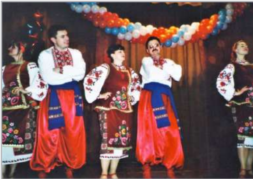
Гонак згуртовує, 2004

Юрій Миколайович чудово вміє комунікувати із колегами та заряджати їх своєю фантастичною енергетикою. Його невидима аура – це постійний позитив.