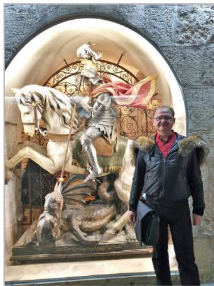
Храм Різдва Христового, м. Вифлеєм, Палестина, 2020