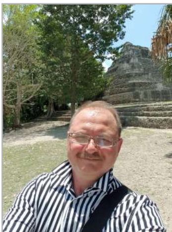
Піраміди Майя, Час-чобен, Мексика, 2019

внутрішнього світу, що призводить до змін у середовищі, та у людей, які оточують його. Відтак, лише змінюючись та удосконалюючись, особистість може бути каталізатором змін у інших. Орієнтація на формування свого професіоналізму особистості якісно змінює структуру буття, дослідницького та наукового середовища. А отже, вчитель – це той, хто завжди є цікавим для своїх учнів: його ідеї, думки та починання. Так, важливим стає саме світогляд – набуває особливої уваги самоосвіта та формування особистісного, наукового та дослідниць-