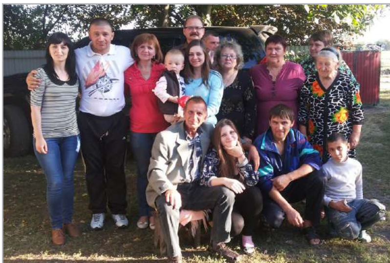
Дружня родина, 2014