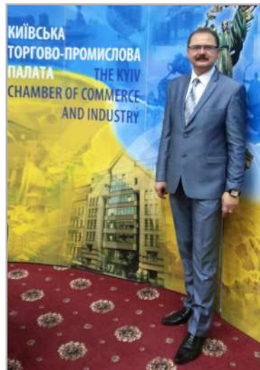
Після робочого засідання, 2014