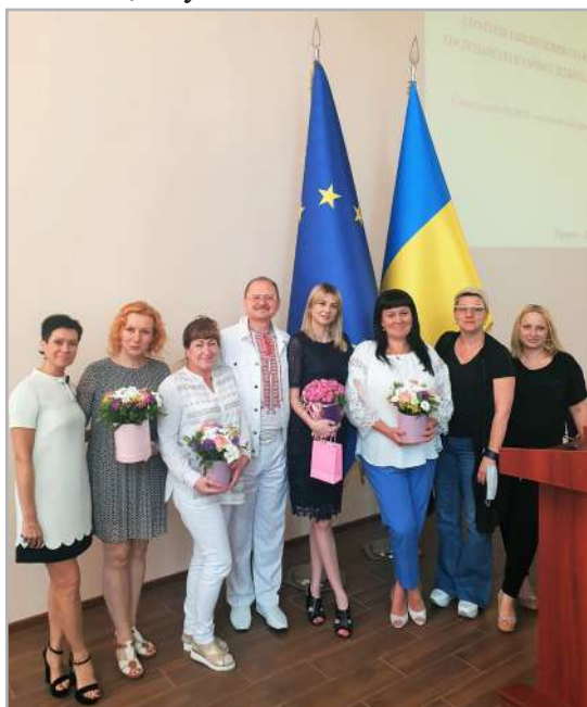
На гостинній чернігівській землі, 2020

кого досвіду не просто як приклад для наслідування, а як модель відображення професійної позиції, що може і має бути наслідувана.