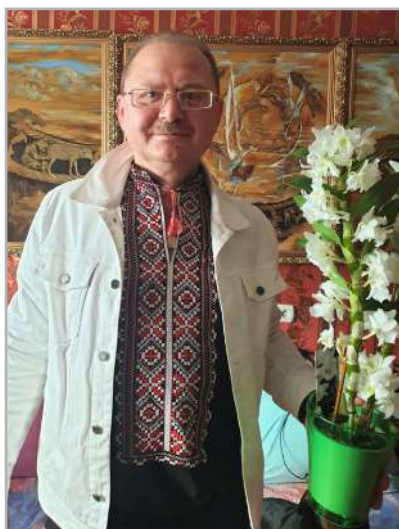
У родинному колі, 2020

Сучасне суспільство часто до особистості вчителя висуває низку вимог, які здебільшого виступають у якості жорстких імператив. Для того, щоб бути успішним науковим лідером та відповідати сучасним викликам та вимогам, вчитель має бути одночасно