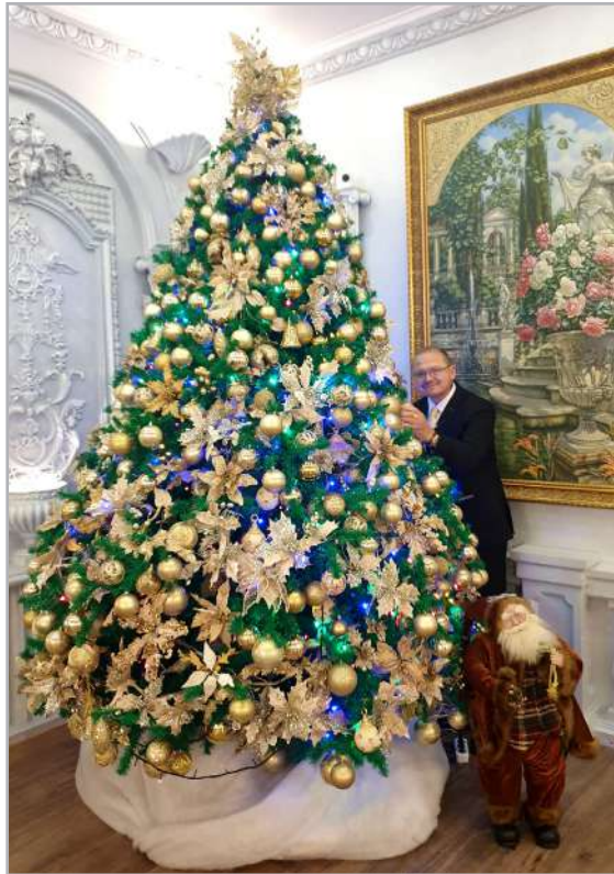
Із новорічним настроєм, 2020

Так і в життєвому й науковому вимірі Юрія Миколайовича: робити те, що об’єднує, що підтримує, що визначає майбутнє, а сьогодні вже є підмурівком для творення грамотної