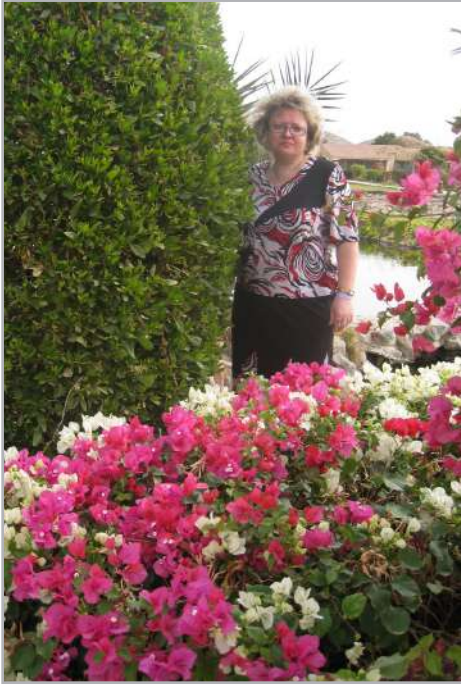
Квітка серед квітів

що моя доля – це Ти: у нещасті та радості! Хочеться написати на Землі, на Венері, на Марсі про те, який Ти неперевершений і найдосконаліший. Але слова не можуть описати повною мірою Тебе, передати все те, що я відчуваю до Тебе! Хочу, щоб Ти пам’ятав, знав і вірив: моє кохання до Тебе – вічне! Ти – Моя Зірка, яка сяятиме для мене, для дітей і нащадків через віки! Мій Янголе! Ти подарував мені Крила, ти подарував мені своє Серце. Це – безцінні подарунки.