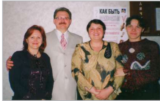
Із колегами деканату Міжнародної економіки і права Криворізького економічного інституту Київського національного економічного університету, 2005