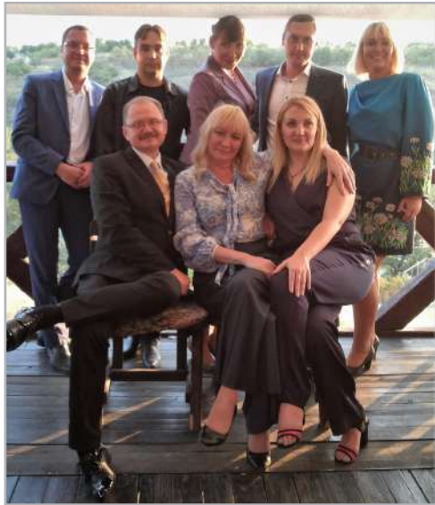
Наукове коло, м. Запоріжжя, 2017