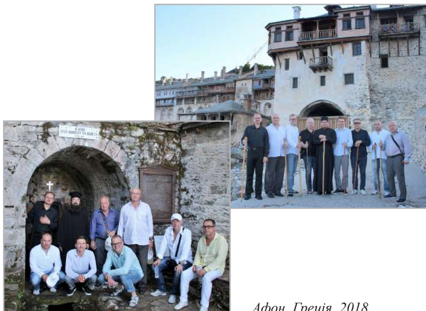
Афон, Греція, 2018