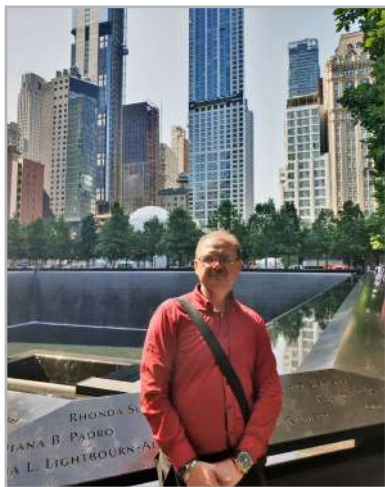
м. Нью-Йорк, 2019

Сьогодні існує суспільна думка про професіоналізм особистості, який трактується як компетентність та педагогічна майстерність, що формують ефективність та успішність вчителя. З іншого боку, я хотіла би проаналізувати професіоналізм особистості в термінах акмеології – розвитку професіонала та досягнення особистісних, професійних та педагогічних вершин. Саме з цієї позиції професіоналізм особистості вчителя – це зростання, становлення індивідуальних якостей та здатностей, професійних знань та вмінь, а найголовніше – якісне перетворення особистістю вчителя свого