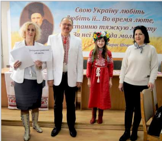
XI Міжнародний мовно-літературний конкурс імені Тараса Шевченка, м. Дніпро, 2020

Вчителю все це вдається не через володіння чудодійними педагогічними, психологічними чи професійними технологіями. Постать вчителя – це результат сотень, а може й тисяч малих і великих взаємодій з кожним своїм учнем – його особистістю, дотиків сердець, тривог і непідробної зацікавленості до своїх послідовників.