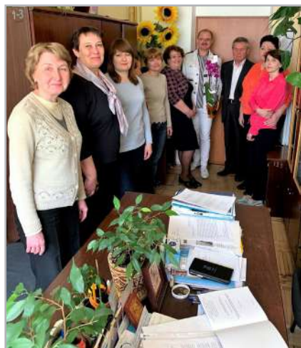
Із колегами, 2019

Керівник – найбільш невдячна робота у світі. Усі ми пам'ятаємо ще з відомої казки, що найскладнішим випробуванням є випробування «мідними трубами».