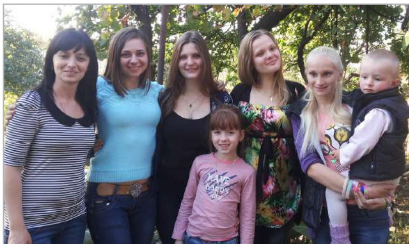
Бабусині внучатка і правнучатка, 2014

І я прошу у Бога щастя і здоров'я для нас і наших близьких. А ще хочеться побільше зустрічатися.