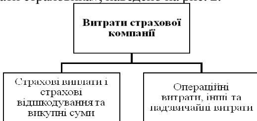
Рис. 2. Склад витрат страхової компанії згідно «Звіту про доходи і витрати страховика»

На сучасному етапі єдиним нормативним документом, який визначає порядок формування прибутку від страхової та інших видів діяльності, а, отже, перелік доходів і витрат, залишається Звіт про доходи і витрати страховика, затверджений розпорядженням Державної комісії з регулювання ринків фінансових послуг України від 03.02.2004 № 39 [19]. Групи витрат, які виділяють згідно «Звіту про доходи і витрати страховика», наведено на рис. 2.