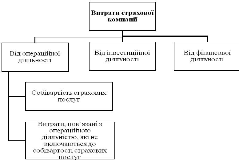
Рис. 3. Склад витрат страхової компанії

На нашу думку, продовжуючи практику розгляду грошових потоків у розрізі видів діяльності, потрібно аналогічно розглядати і витрати за цими видами діяльності. Тобто, витрати страхової компанії мають розподілятися на три основні групи: витрати від страхової діяльності, витрати від інвестиційної діяльності та витрати від фінансової діяльності. Найскладнішою є перша група витрат, враховуючи особливості страхування. Ми вважаємо, що її потрібно поділити в свою чергу ще на дві підгрупи: собівартість страхових послуг і витрати, пов'язані з операційною діяльністю, які не включаються до собівартості страхових послуг. Схематично таку класифікацію витрат представлено на рис. 3.