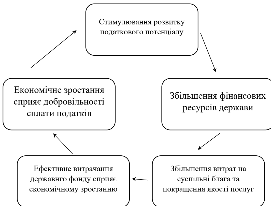
Рисунок 1.1 – Механізм забезпечення економічного зростання країни

Для досягнення стійкого економічного зростання необхідні активна урядова політика та втручання. Більшість податкових інструментів впливають на поведінку компаній; Завдання полягає в тому, щоб збалансувати стимули зі сталим розвитком і національними цілями. Бюджетна та податкова політика має бути узгоджена з пріоритетами сталого розвитку в усіх сферах, що досягається, наприклад, розробкою національної стратегії фінансування центрального банку. Прозорість податкових інструментів, закупівель і державних витрат сприятиме ефективному використанню державних ресурсів для досягнення ЦСР. Інструменти контролю мають бути пов'язані з результатами досягнення ЦСР, обмежені в часі та регулярно переглядатися на фоні глобальних викликів. Закупівельна політика має бути спрямована на