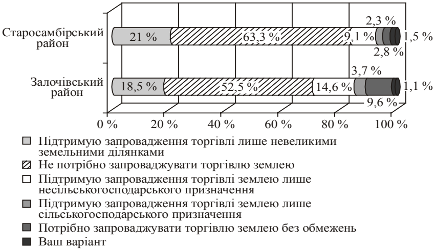
Рис. 1. Розподіл думок респондентів стосовно можливості запровадження в Україні вільної купівлі-продажу землі

Переважна більшість опитаних мешканців обох районів вважає, що запроваджувати торгівлю землею в сучасних умовах непотрібно, і лише 9,6 % опитаних респондентів Золочівського району та 2,8 % опитаних респондентів Старосамбірського району підтримують торгівлю землею без обмежень. Зважаючи на факт дефіцитності землі у Старосамбірському районі, відсоток мешканців даної території, які заперечують можливість запровадження вільної купівлі-продажу землі, є вищим. Таке негативне ставлення мешканців територій до зняття мораторію на купівлю-продаж землі можливо змінити лише у випадку проведення державою прозорої, передбачуваної, послідовної, узгодженої з думкою громадськості політики регулювання земельних відносин. Успішне проведення земельної реформи розширить можливості сільської території більш повно реалізовувати свій ресурсний потенціал.