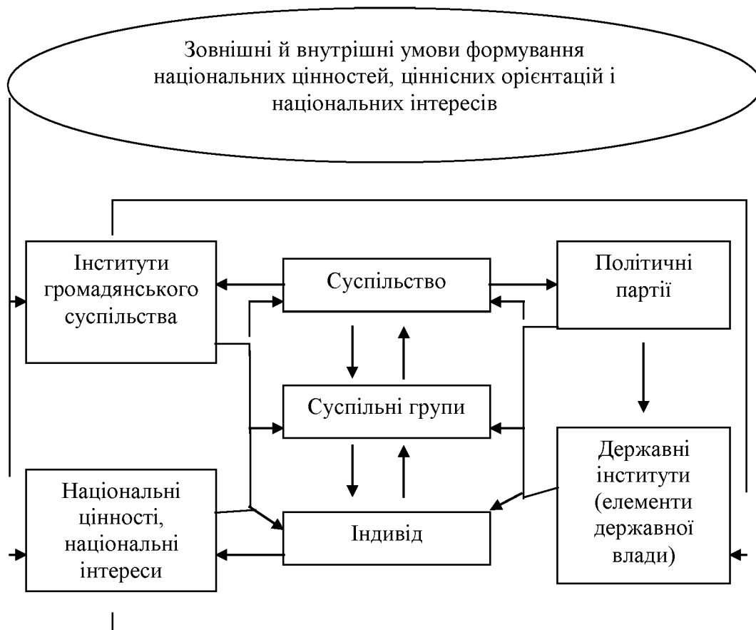
Рис. 3.1. Принципова структурно-логічна схема системи формування і узгодження соціальних інтересів.

Громадські організації також повинні стати важливим, реальним каналом представництва різних суспільних інтересів, впливовими й авторитетними посередниками між їх носіями та органами державної влади, що створило б об'єктивні передумови для делегування владними структурами певної частини своїх повноважень цим організаціям.