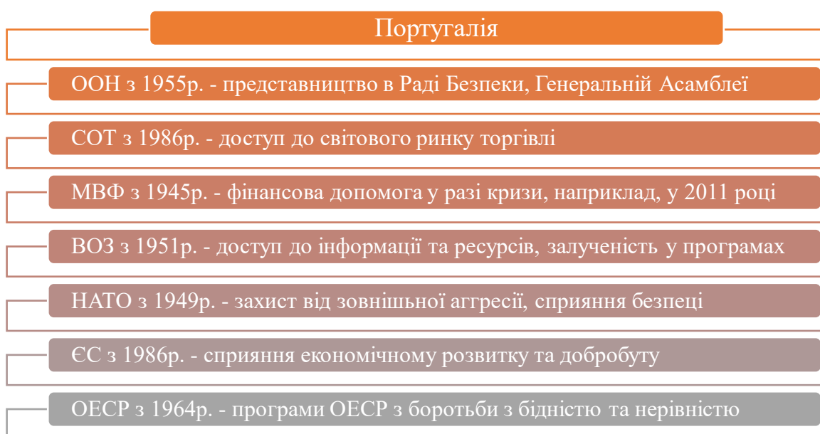
Рис. 2.2 – Рік вступу та основні переваги від вступу та перебування в міжнародних організаціях для Португалії

У результаті міжнародних економічних і фінансових викликів, які також неминуче торкнуться Португалії, зовнішня політика має сприяти просуванню іміджу країни та стати головним каталізатором економічного та соціального розвитку.