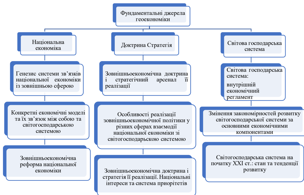
Рис. 1.1 – Загальнотеоретична панорама системи «геоекономіка»

Джерело: розроблено автором на основі [1-4]