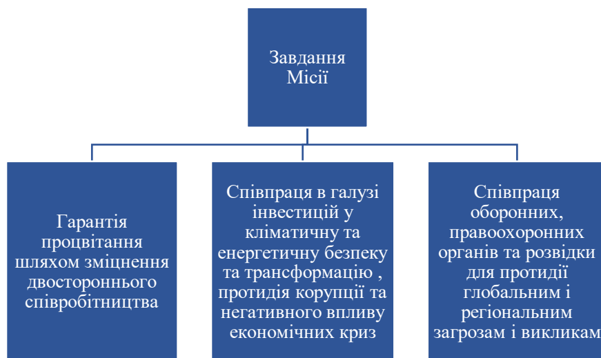
Рис. 2.3 – Головні завдання Місії США щодо розбудови Португалії