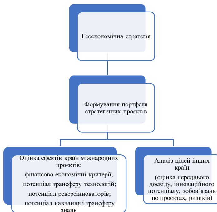
Рис. 1.2 – Схема створення геоeкономічної стратегії реалізації міжнародного проєкту