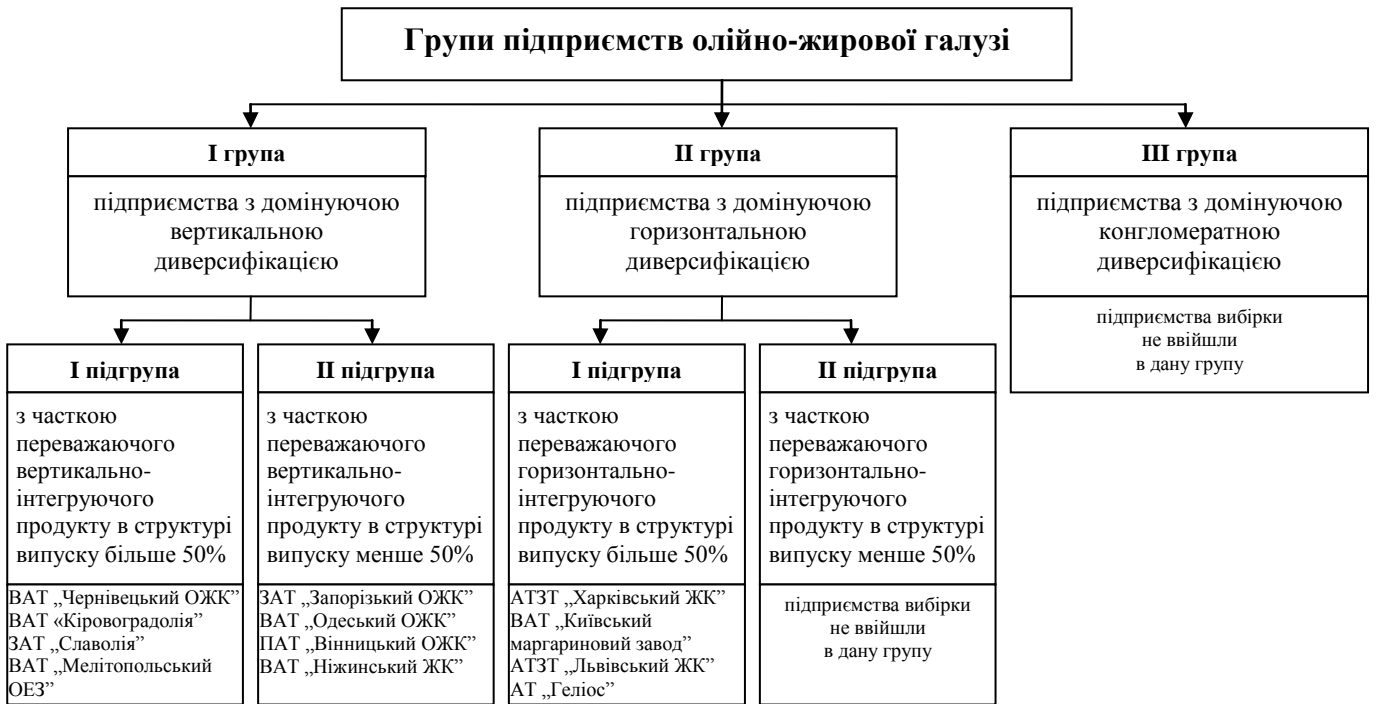
Рис. 2. Розподіл досліджуваних підприємств олійно-жирової галузі за видами виробничої диверсифікації