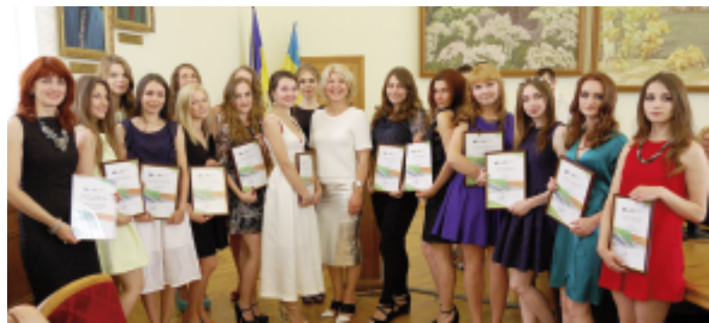
НАШІ ВИПУСКНИКИ РОБЛЯТЬ УСПІШНУ ПРОФЕСІЙНУ КАР'ЄРУ У ВЕЛИКИХ ВІТЧИЗНЯНИХ ТА МІЖНАРОДНИХ КОМПАНІЯХ!