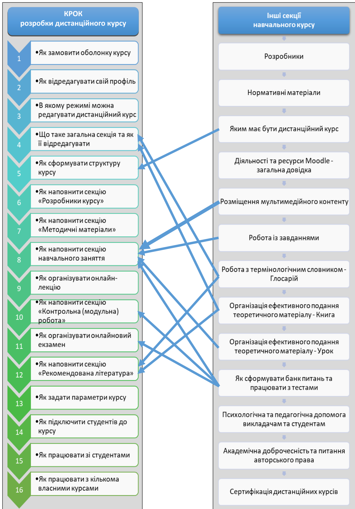
Рис. 1. Компоненти навчального онлайн-курсу «Створюємо дистанційний курс крок за кроком»