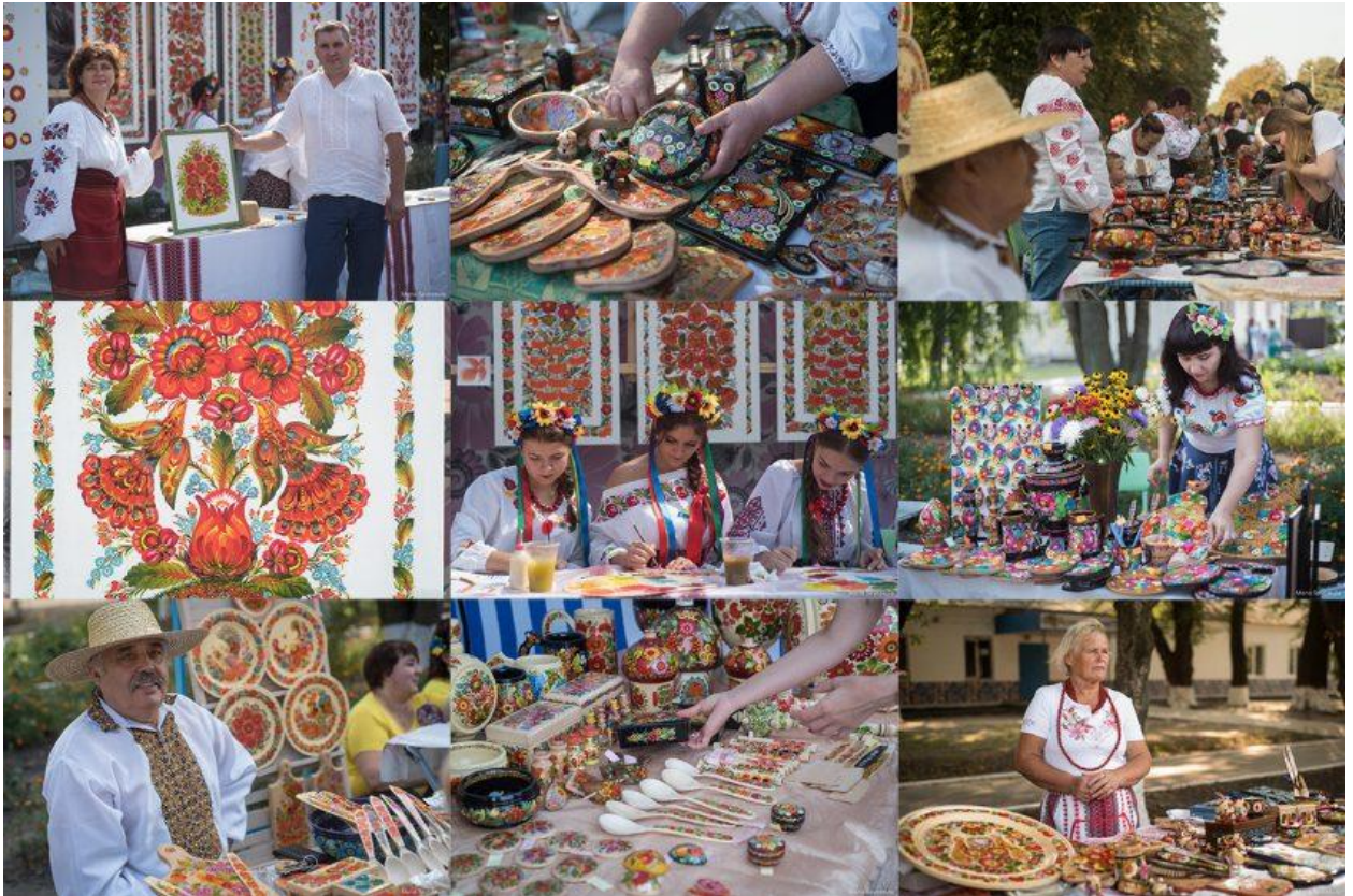
Рисунок 2.7. Фестиваль петриківського розпису

Зростання туристичного потоку на території Петриківської громади стало вагомим каталізатором розвитку місцевої туристичної інфраструктури. За даними місцевої адміністрації, щорічна кількість відвідувачів громади зростає з приблизно 3 тисяч осіб у 2015 році до понад 18 тисяч у 2023 році, що свідчить про стабільну динаміку зростання інтересу до культурно-туристичних продуктів регіону. Такий приріст туристів стимулював активну фазу інвестицій у сферу розміщення та обслуговування.