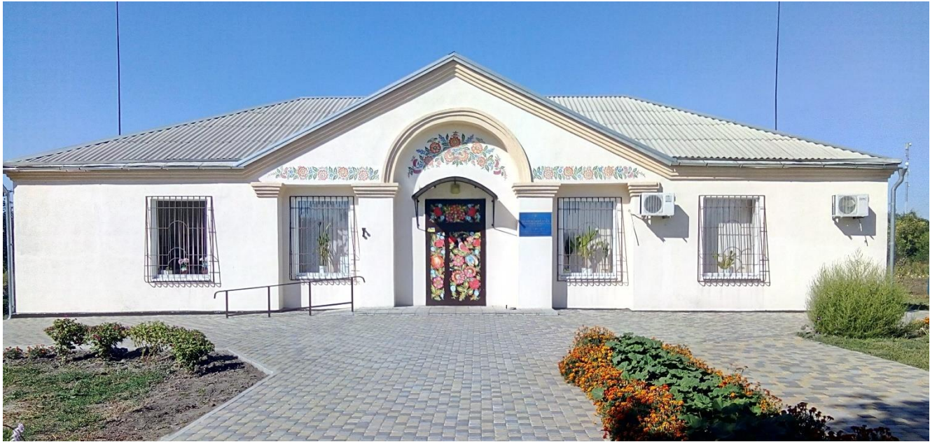
Рисунок 2.5. Музей Петриківського розпису

Петриківська громада активно розвиває культурно-освітні проекти, пов'язані з Петриківським розписом. Туристи мають змогу не лише спостерігати за процесом створення картин, але й навчитися техніки малювання, що робить цей аспект дуже привабливим для любителів народного мистецтва та культурного туризму (Рис. 2.6).