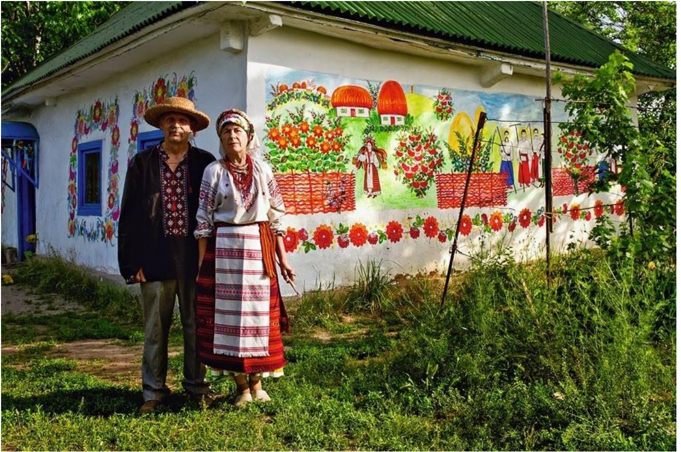
Рисунок 2.1. Музей-садиба «Миколин Хутір»

Петриківський регіон демонструє стійку позитивну динаміку розвитку туристичної та супутньої інфраструктури, що є ключовим чинником у формуванні його привабливості як перспективної сільськогосподарсько-туристичної дестинації. Зокрема, у селі Судівка функціонує зелена садиба «Благодатне», яка входить до всеукраїнської програми «Українська гостинна садиба», ініційованої Спілкою сільського зеленого туризму в Україні. Участь у цій програмі засвідчує відповідність об'єкта сучасним стандартам якості обслуговування, орієнтованим на екологічність, автентичність та комфорт для відвідувачів, зокрема туристів із європейських країн.