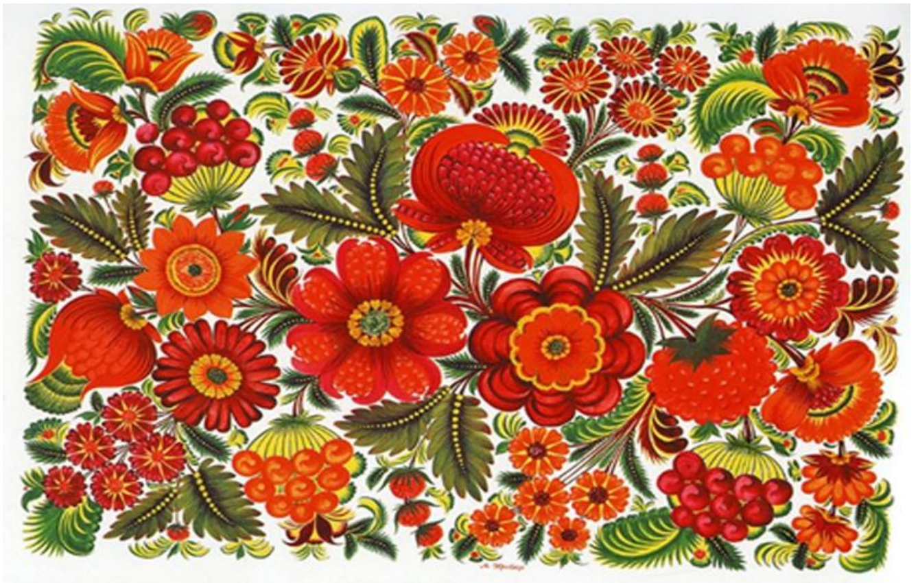
Рисунок 2.6. Петриківський розпис

Петриківська громада активно розвиває культурно-освітні проекти, пов'язані з Петриківським розписом. Туристи мають змогу не лише спостерігати за процесом створення картин, але й навчитися техніки малювання, що робить цей аспект дуже привабливим для любителів народного мистецтва та культурного туризму (Рис. 2.6).