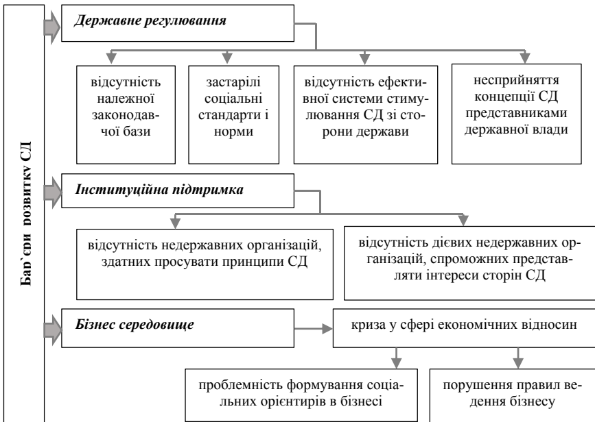
Рисунок 1. Бар'єри формування та розвитку соціального діалогу в Україні [2]

ключових факторів розвитку СД в Україні, зокрема факторів, що впливають на його ефективність, особливості розвитку на різних рівнях.