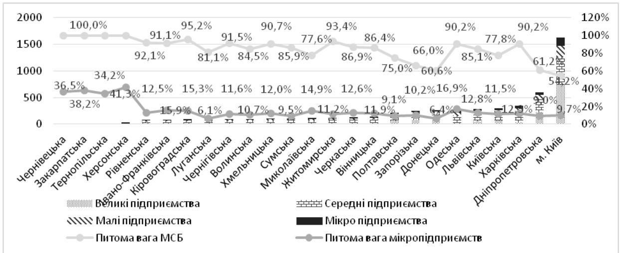
Рис. 2. Кількість найманих працівників у залежності від розміру підприємства в 2017 р., тис. осіб.

З рис. 2 можна побачити, що наявні регіональні диспропорції за кількістю працюючих в залежності від виду підприємства, аналіз яких свідчить, що більшість найманих працівників задіяно на підприємствах середнього бізнесу (близько 52 %). При цьому варто зауважити, що середні підприємства складають близько 5 % серед усіх підприємств в Україні.