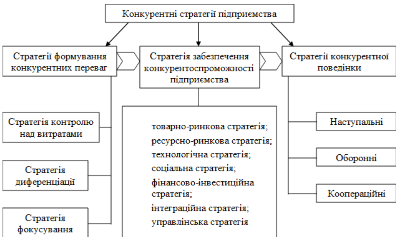
Рис. 1. Система конкурентних стратегій підприємства [2, с. 80]

Існує широкий спектр стратегій ринкової конкуренції, які об'єднують в систему конкурентних стратегій підприємства (рис. 1).